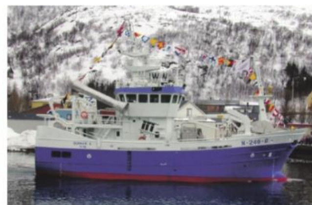
Dagens «Gunnar K» er 16 år gammel og skal erstattes av en ny 126 fot snurrevad. Bildet viser «Gunnar K» da den ankom Myre for første gang i år 2000. (Arkivfoto)

kan levere. Vi handler gjerne lokalt hvis de er konkurransedyktige på pris og kvalitet. Jeg håper derfor at det er noen lokale som melder seg for å levere varer og tjenester til oss, sier Kristoffersen.